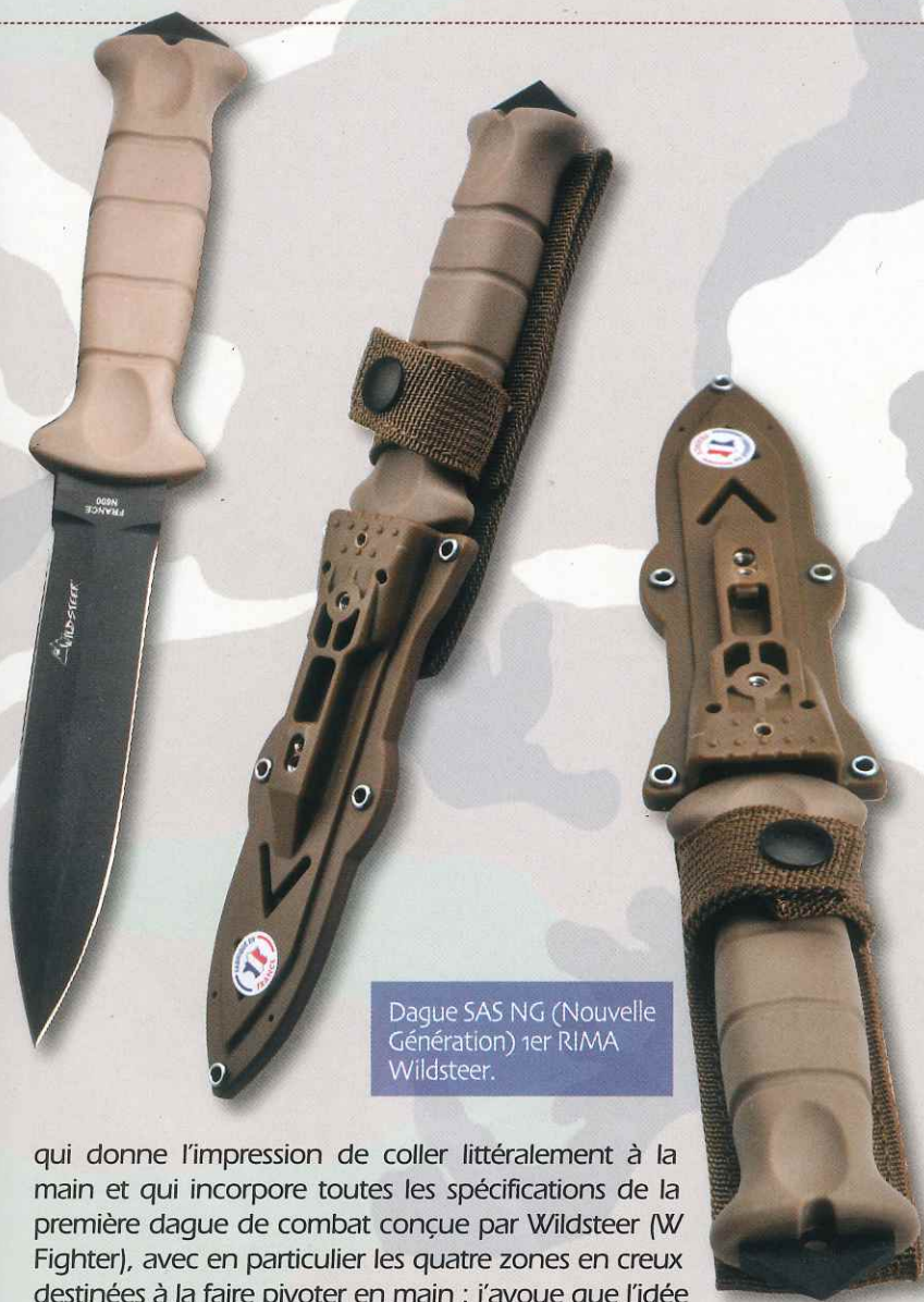
Dague SAS NG (Nouvelle Génération) 1er RIMA Wildsteer.