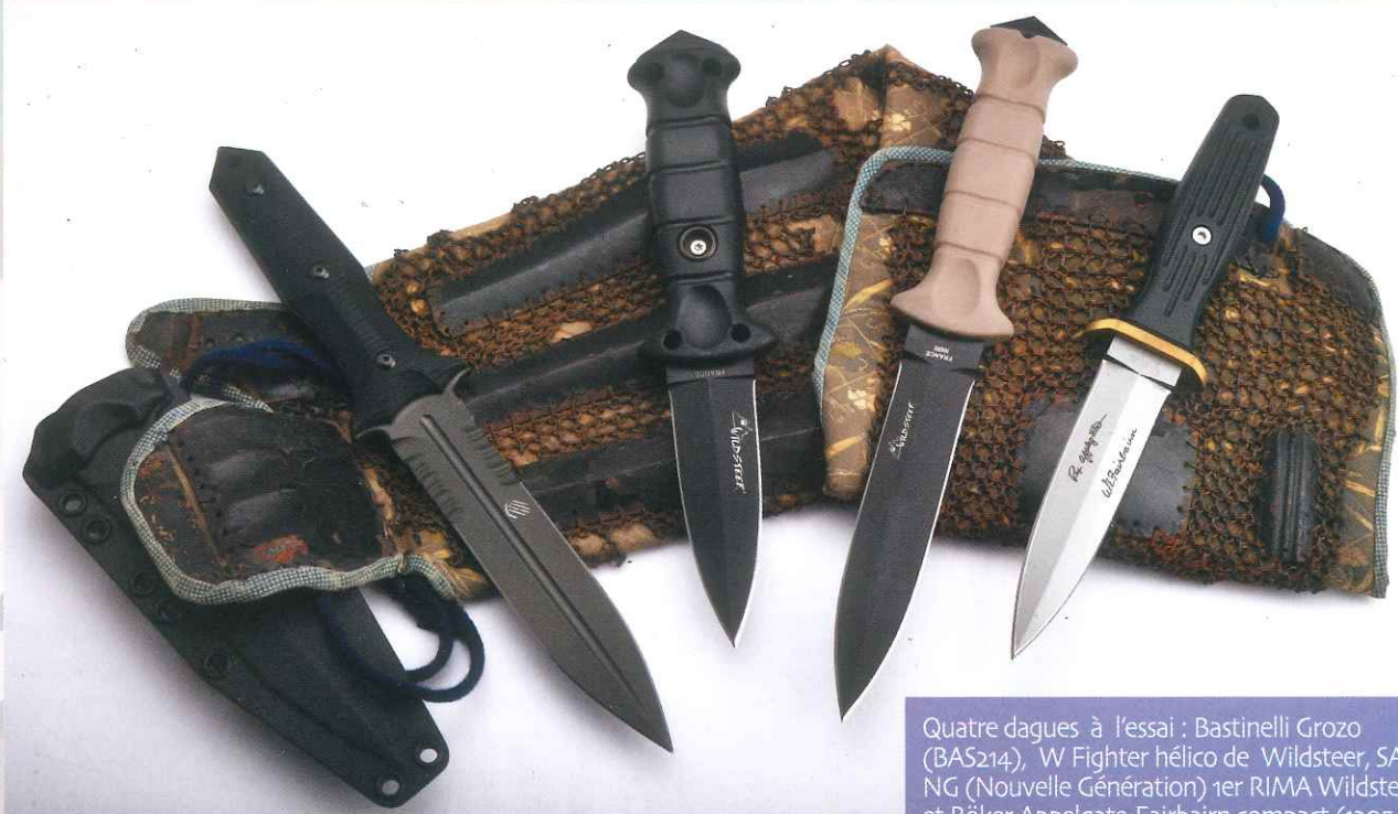
Quatre dagues à l'essai : Bastinelli Grozo (BAS214), W Fighter hélico de Wildsteer, SAS NG (Nouvelle Génération) 1er RIMA Wildsteer et Böker Appelgate-Fairbairn compact (120546).

Les dagues figurant dans cet article sont toutes des dagues personnelles qui témoignent d'une recherche d'un outil militaire réaliste disposant d'un tranchant permettant l'accomplissement des tâches ordinaires dévolues à un bon coupeur, condition sine qua non de leur achat et divine surprise, en 2019 le choix sans être surabondant existe vraiment, dans un domaine que d'aucuns déclaraient moribond.