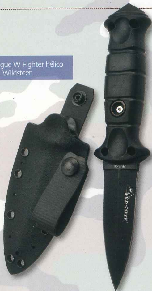
Dague W Fighter hélico de Wildsteer.